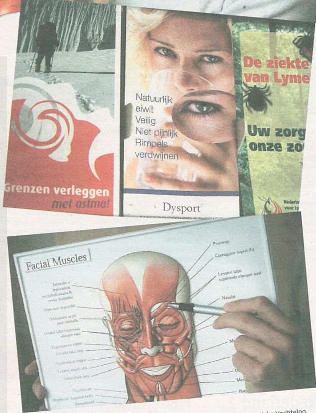
Naast huisdokter ook cosmetisch arts.

„Een belangrijk aspect. Mensen met een laag zelfbeeld kunnen beter eerst aan hun geestelijke gesteldheid werken. Een rimpelvuller vult de huid maar niet het gebrek aan eigenwaarde op. Ik kijk goed naar mensen voordat ik ze behandel. Bovendien houd ik mijn grenzen scherp in de gaten. Ik experimenteer niet en raad verregaande veranderingen af. Overcorrecties maken een gezicht